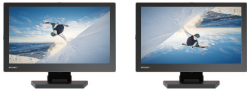
反転表示機能で設置方法に合わせた映像表示

デジタル入力時、フル HD 以外の映像信号を入力した際、ピクセル等倍表示機能で実際入力されたピクセル数での映像表示が可能となります。また設置場所や用途に合わせて上下、左右での画面反転表示が可能です。